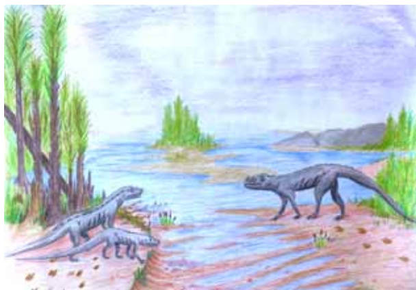
Chirotherien an einer Lagune. So könnte die Landschaft vor 247 Millionen Jahren um Hohenroth herum ausgesehen haben. Zeichnung: Hannah Thomas u. Julia Seubert

Im Bereich der NES-Allianz Gemeinden gibt es zahlreiche Altrechtliche Waldkörperschaften. Diese bewirtschaften ihre Wälder seit vielen Jahrhunderten. Als das Bürgerliche Gesetzbuch (BGB) am 01. Januar 1900 in Kraft trat hatte man leider vergessen, die rechtlichen Angelegenheiten der Arkö im BGB zu regeln. Jetzt rächt sich das. Die Satzungen, soweit es welche gibt, sind teils völlig überholt oder mit aktuellem Recht nicht mehr vereinbar. Daraus ergeben sich zunehmend große Schwierigkeiten. So können sich die Arkö keine neue Satzung geben. Es fehlt dazu die Rechtsgrundlage. Es entstehen Probleme bei Grundstücks- und Bankgeschäften. Auch die Haftung der Mitglieder ist problematisch. Wirksame Beschlüsse können z.T. nur noch schwer oder gar nicht gefasst werden.