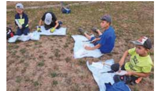
Eure Jugendbetreuerin Unter- & Oberebersbach