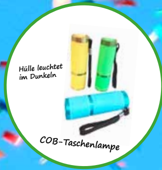
Hülle leuchtet im Dunkeln